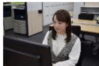
職場で活躍するミラエール社員

「ミラエール」は未経験から事務職に就きたい人を応援する無期雇用派遣のサービスで、2014年に当社が業界ではじめて導入しました。東京・名古屋・大阪などの大都市圏を中心（※4）にサービスを展開し、現在は約6,400人以上が就業し、取引社数は2,000社以上です。「ミラエール」に入社をする方の約72%が採用時では販売サービス職を中心とした事務職未経験者のため（20年度）、研修・教育、入社後のキャリアサポートを充実させているのが特徴です。