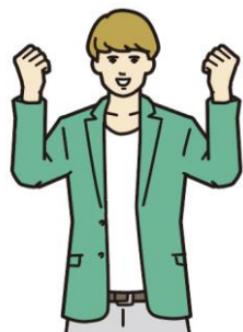
Z世代： 1996年～2005年 生まれの16～25歳