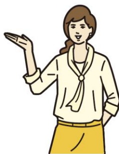
ミレニアル世代： 1981年～1995年 生まれの26～40歳