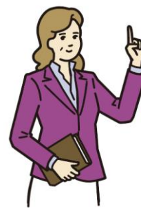
バブル期世代： 1961年～1970年 生まれの51～60歳