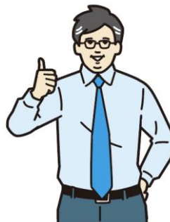
就職氷河期世代： 1971年～1980年 生まれの41～50歳